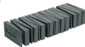
Keile, 30 Stück