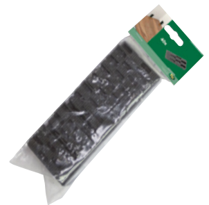
Verpackung Verlegekeile á 40 Stk